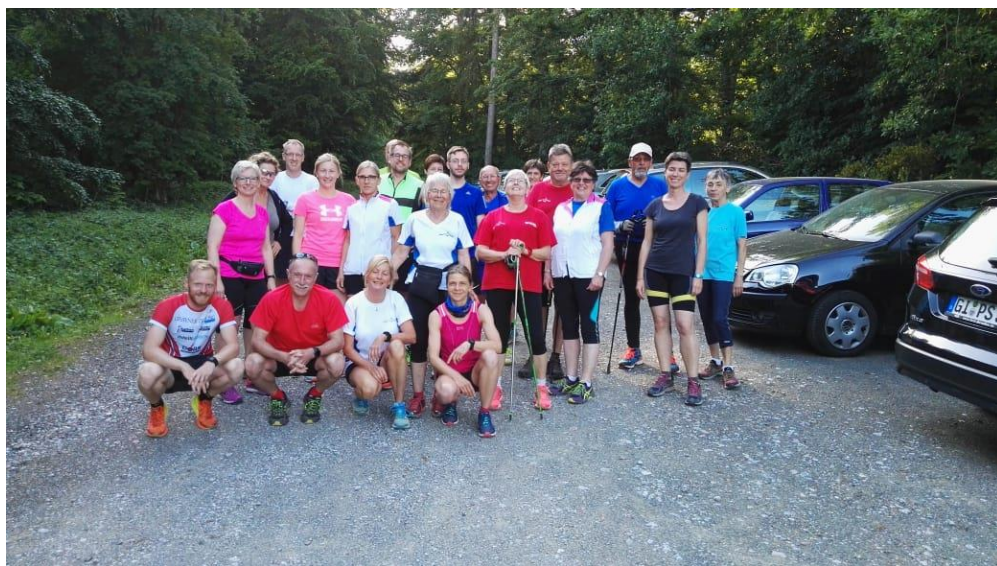
Trainingsteilnehmer aus 2018

Weitere Infos unter: http://www.lt-biebortal.de/